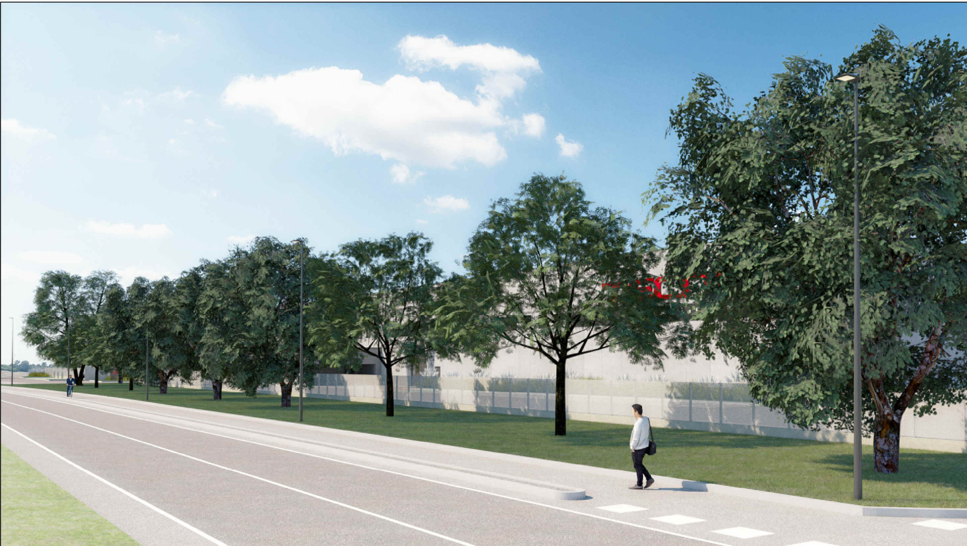
VISTA NORD - EST - PROSPETTO PRINCIPALE DA VIA FRANCESCO SOMMA