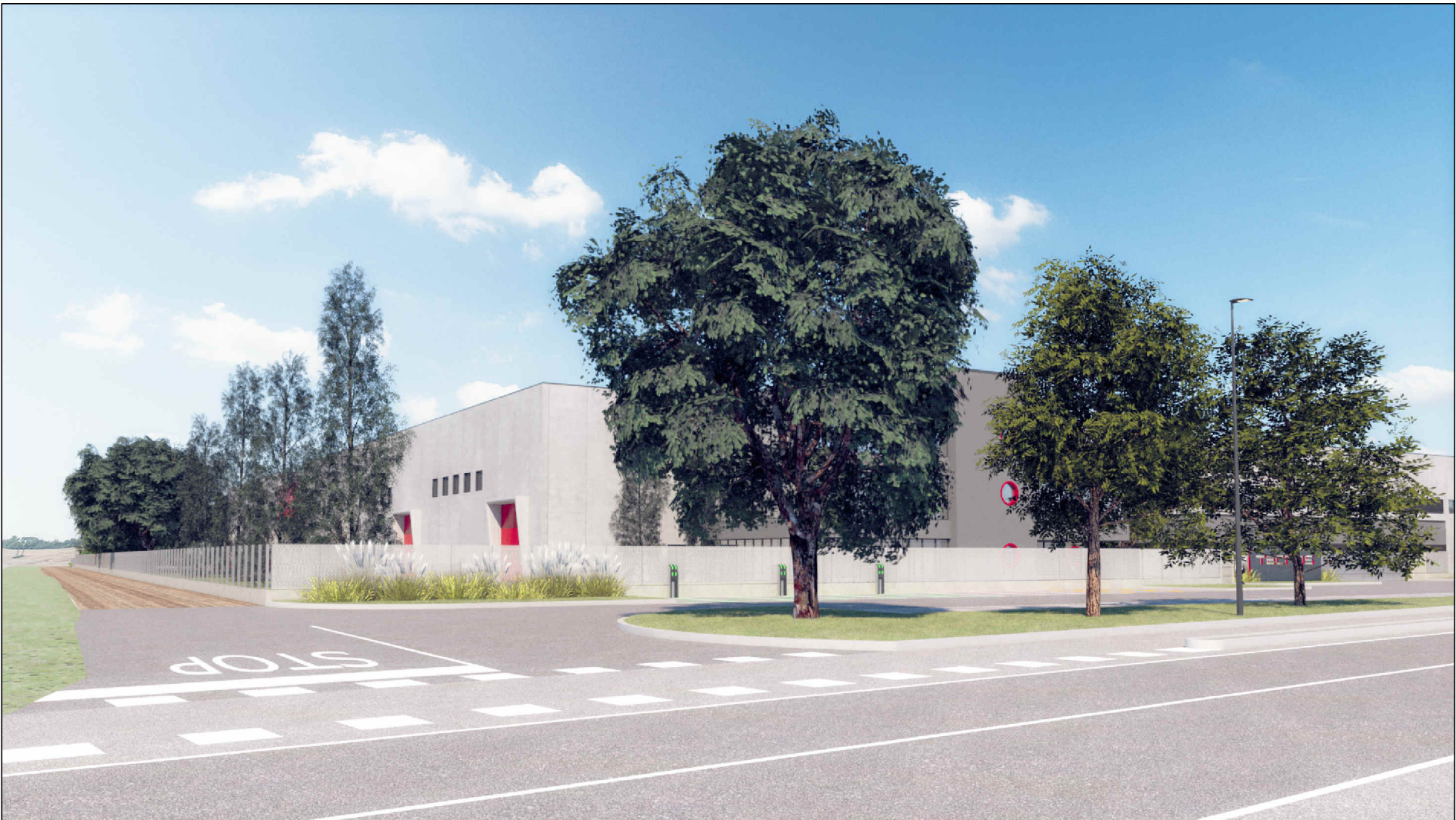
VISTA SUD / EST - DA VIA FRANCESCO SOMMA