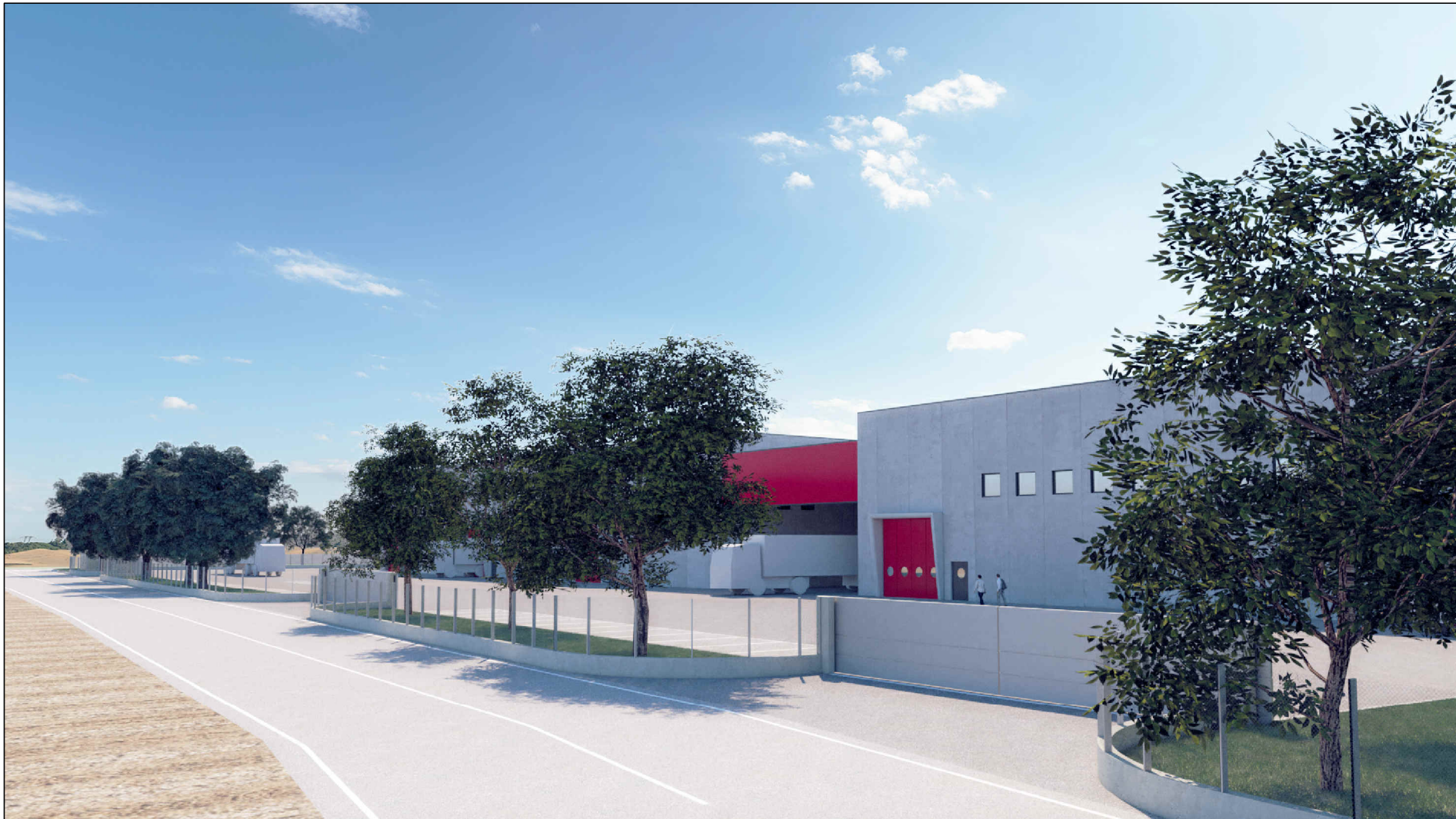
VISTA NORD - DA STRADA PRIVATA A NORD E PIAZZALE DI MANOVRA