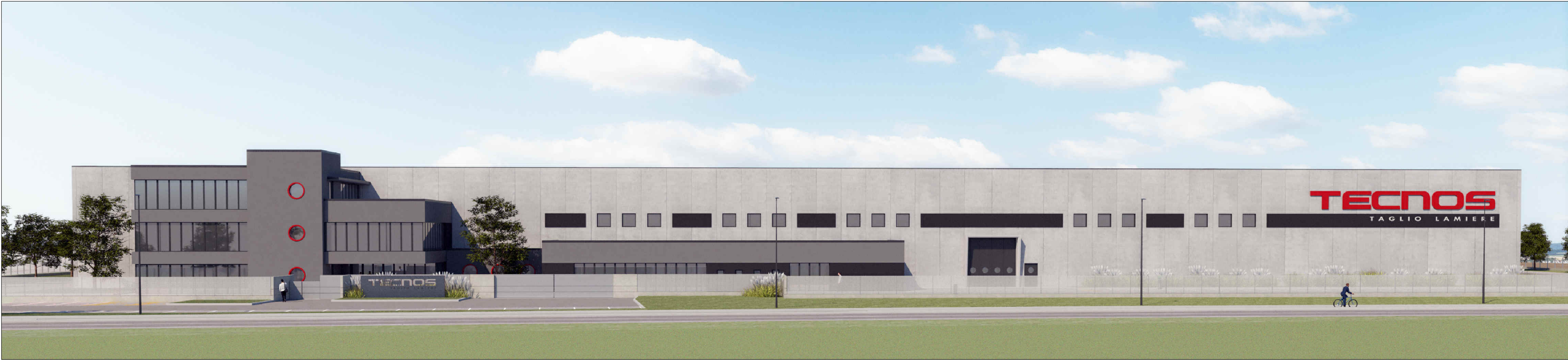
VISTA FRONTALE PROSPETTO PRINCIPALE LUNGO VIA FRANCESCO SOMMA (QUINTA VERDE DI MITIGAZIONE NON RAPPRESENTATA)