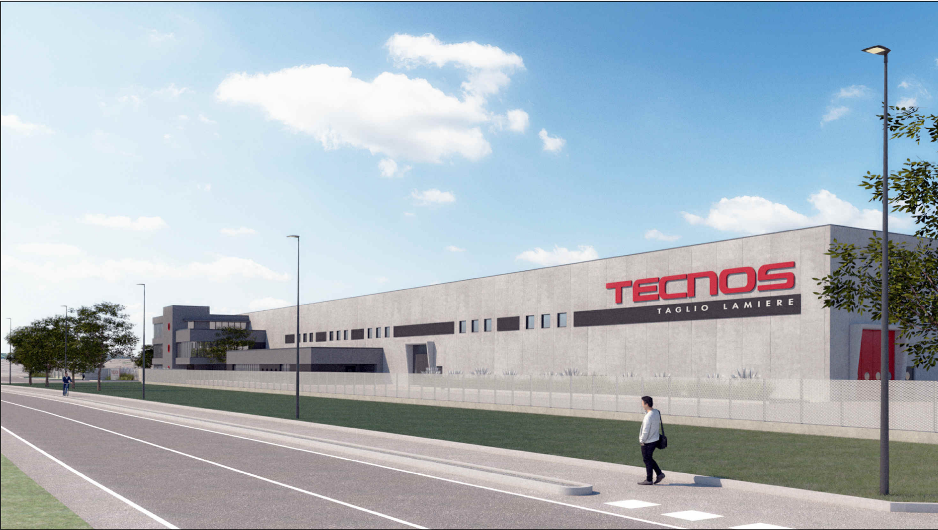
VISTA NORD - EST DEL PROSPETTO PRINCIPALE LUNGO VIA FRANCESCO SOMMA (QUINTA VERDE DI MITIGAZIONE NON RAPPRESENTATA)