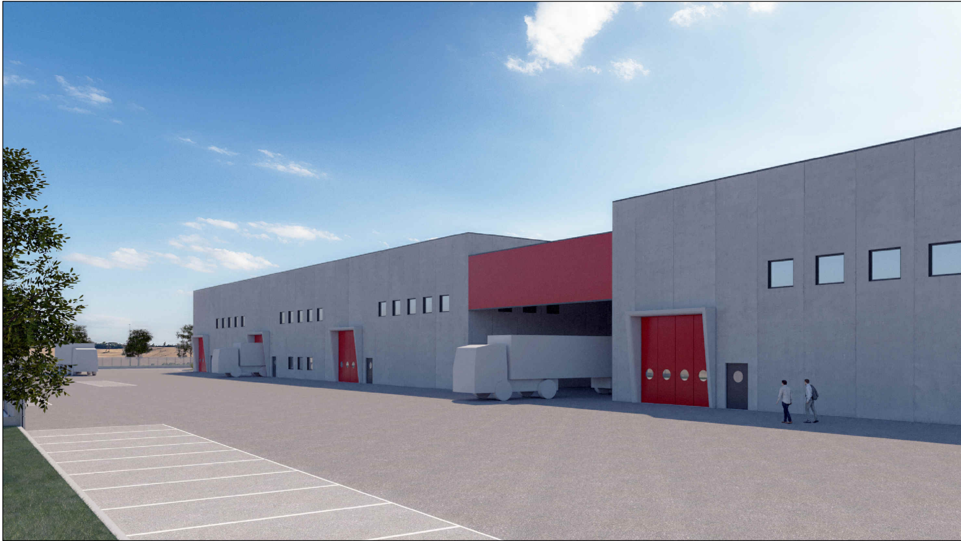
VISTA NORD SU PIAZZALE DI MANOVRA (QUINTA VERDE DI MITIGAZIONE NON RAPPRESENTATA)