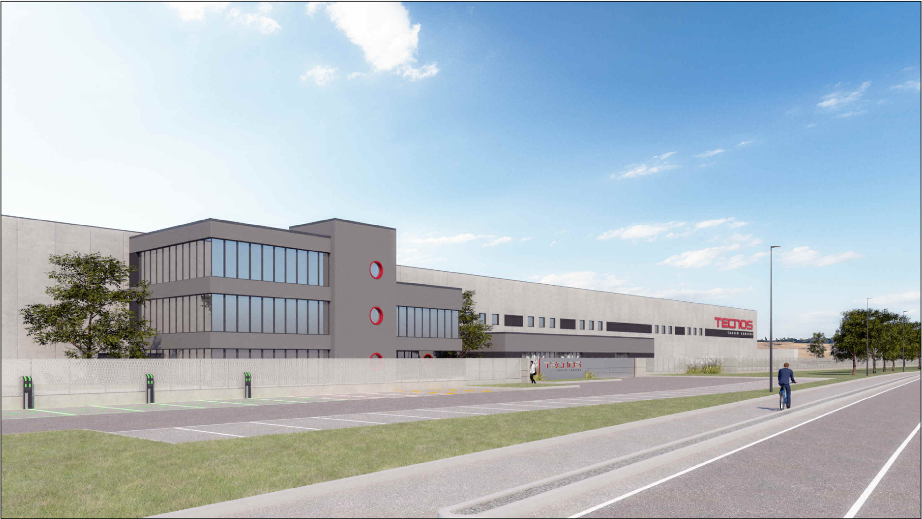
VISTA SUD - EST DEL PROSPETTO PRINCIPALE LUNGO VIA FRANCESCO SOMMA (QUINTA VERDE DI MITIGAZIONE NON RAPPRESENTATA)