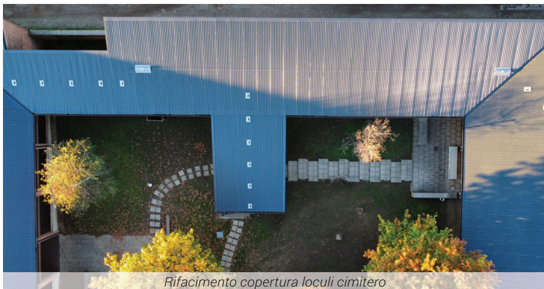
Rifacimento copertura loculi cimitero

Grazie alla collaborazione di uno sponsor, Notari Impresa Spa, che ringraziamo nuovamen-