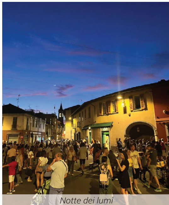
Notte dei lumi