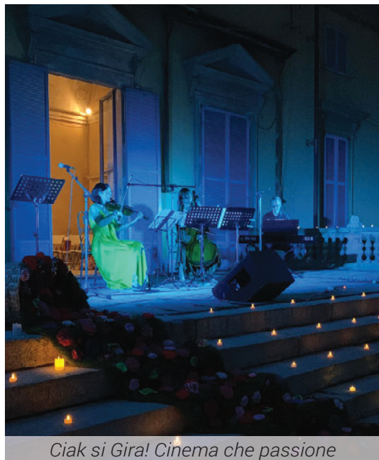
Ciak si Gira! Cinema che passione

Grazie davvero a chi ha organizzato, a chi ha partecipato, ma anche a chi ha suggerito nuove proposte, non mancheremo di continuare su questa strada di collaborazione e disponibilità.