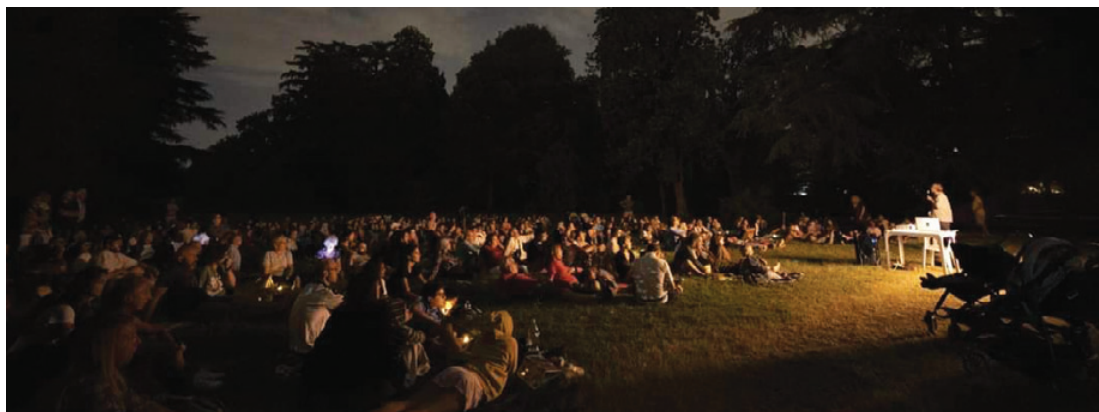
Sotto un cielo stellato

Altro grande successo è stata la Notte dei Lumi . Ripartire dopo un lungo stop con l'entusiasmo di sempre non è stato facile e non lo è stato nem-