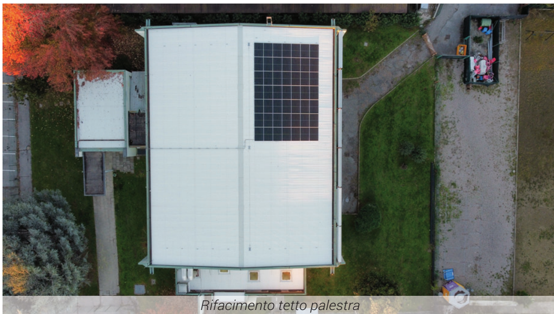
Rifacimento tetto palestra

È stato un intervento importante che credo tutti oggi possiamo apprezzare.