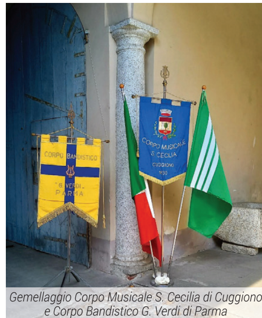
Gemellaggio Corpo Musicale S. Cecilia di Cuggiono e Corpo Bandistico G. Verdi di Parma