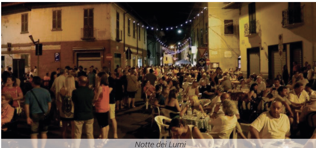
Notte dei Lumi

Domenica 10 luglio sarà invece dedicata ai bam-