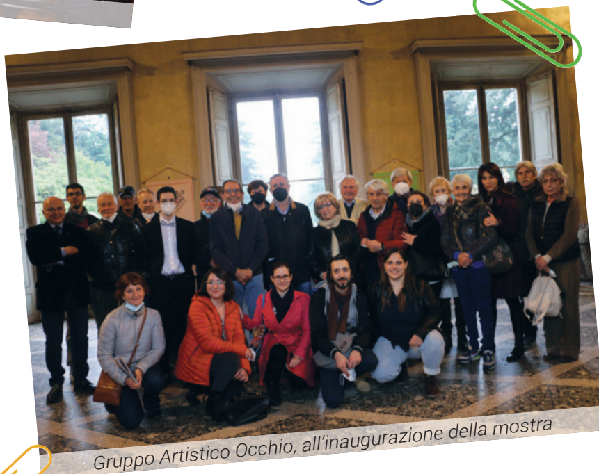
Gruppo Artistico Occhio, all'inaugurazione della mostra