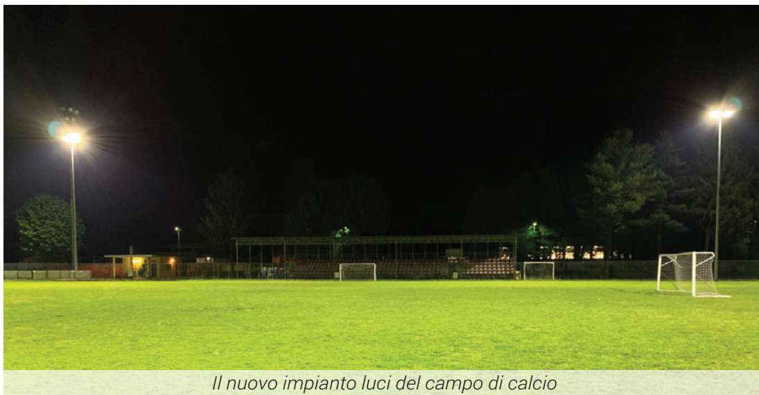
Il nuovo impianto luci del campo di calcio

Dopo questa necessaria introduzione ripartirei aggiornando le informazioni date nello scorso mese di gennaio.