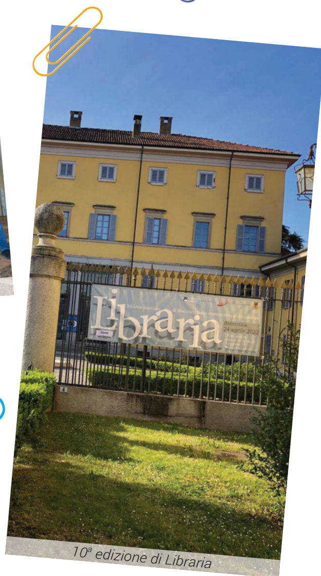
10ª edizione di Libreria