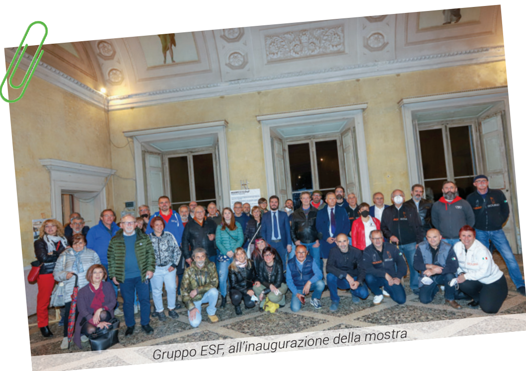
Gruppo ESF, all'inaugurazione della mostra