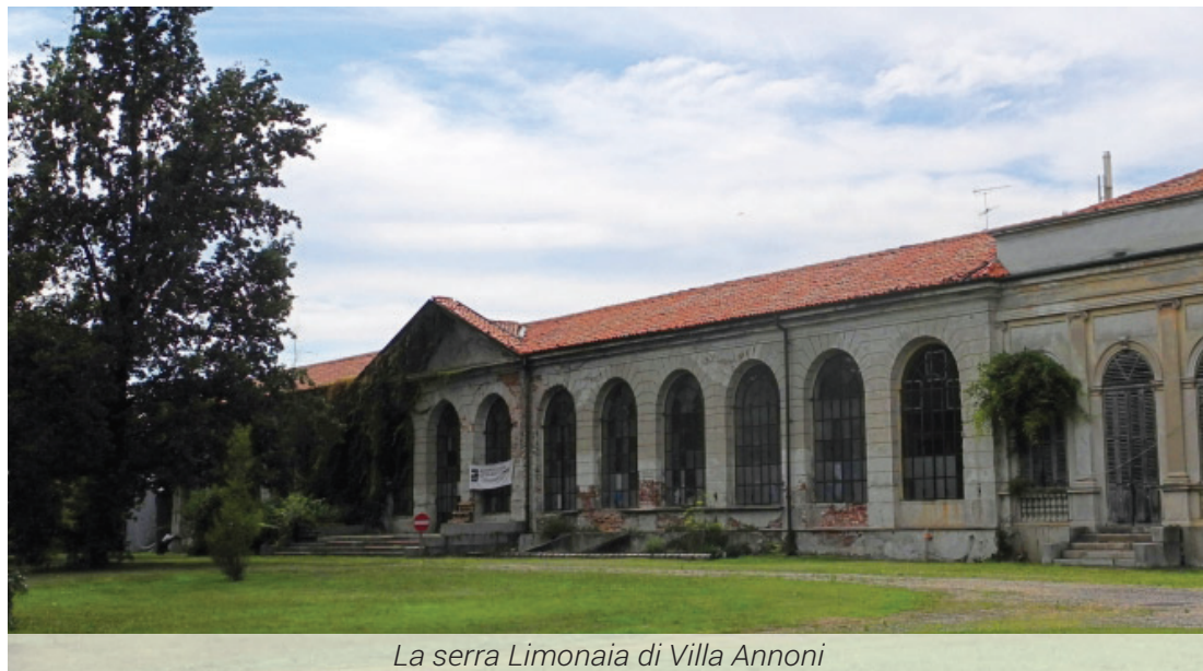
La serra Limonaia di Villa Annoni

Dopo l'intervento eseguito a gennaio per il rifacimento dell'impianto di produzione di acqua calda che abbiamo dovuto eseguire in emergenza con un importante investimento recuperato da risorse uni-