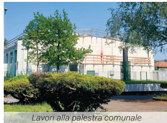
Lavori alla palestra comunale

Nulla di cambiato rispetto all'ultimo aggiornamento, se non che, purtroppo, continua il ricambio di personale che certamente non rende agevole l'attività. Speriamo presto di risolvere anche questa criticità.