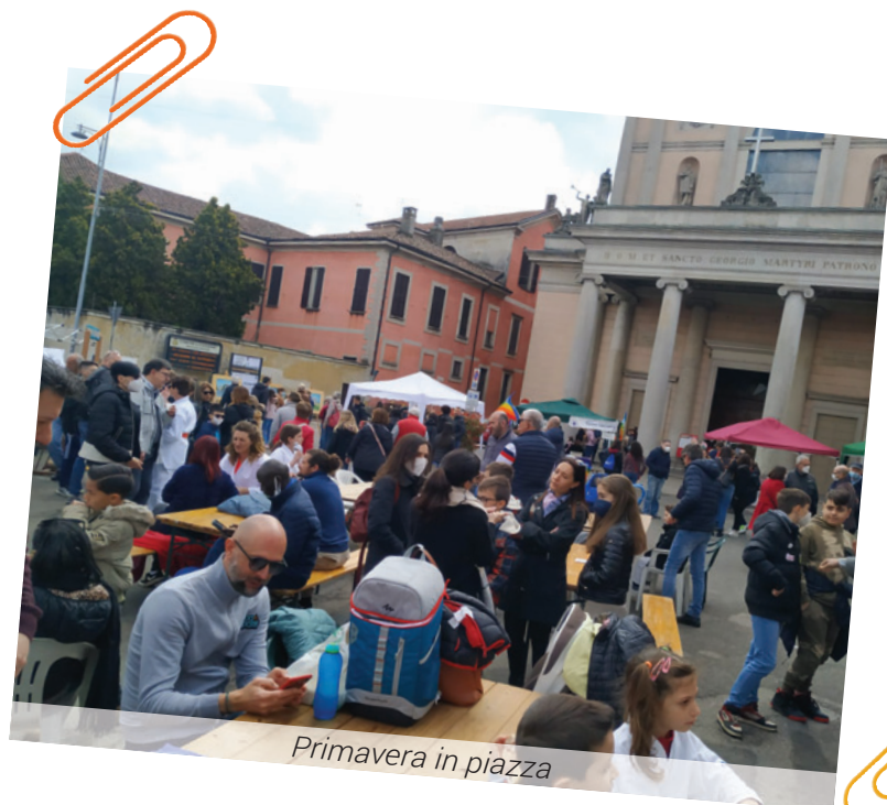
Primavera in piazza