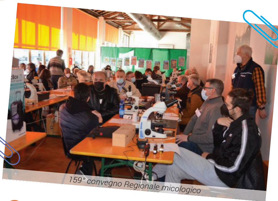
159° convegno Regionale micologico