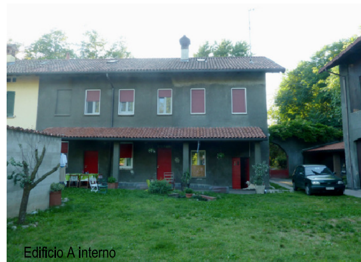
Edificio A interno