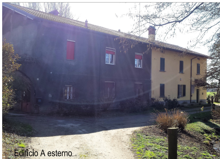
Edificio A esterno